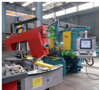
Banc perçage sciage SPH600.

Comesor est une PME spécialisée depuis plus de 30 ans dans la conception et le développement de machines spéciales à commande numérique destinées à la construction métallique : bancs de perçage-sciage, machines de découpe plasma, lignes de poinçonnage, machines à découper les tubes